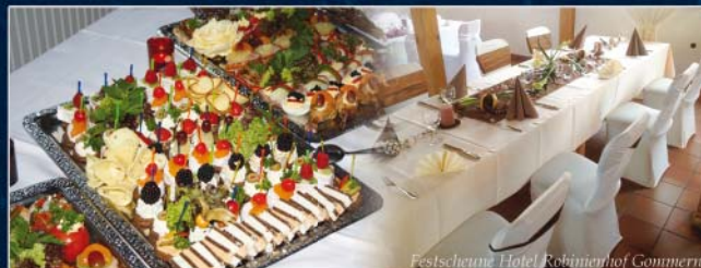
Festscheune Hotel Robinienhof Gommern