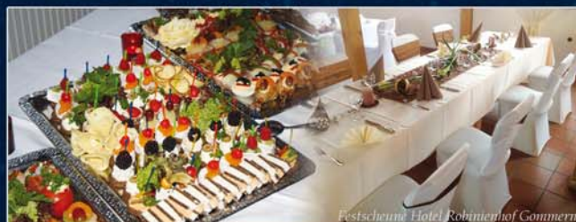
Festscheune Hotel Robinienhof Gommern